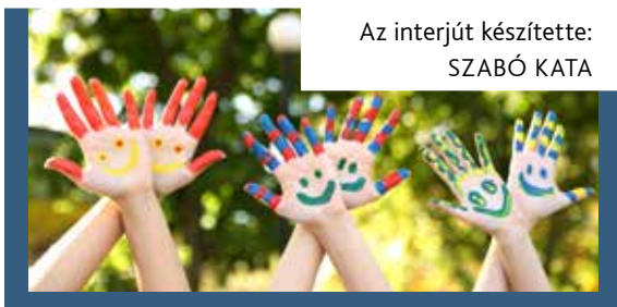
Az interjút készítette: SZABÓ KATA