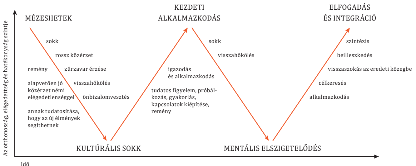
1. ábra: A kultúrsokk W-modellje 6

A sojourn kulturális jellemzőinek megismerése mellett fontos megérteni az ezen időszak alatt fellépő alkalmazkodási folyamatot is. Erre a célra az egyik legelterjedtebb modell az eredetileg Lysgaard 4 által 1955-ben leírt, a kultúrsokk szakaszait ismertető U-görbe, amelyet a későbbiekben több kutató többféleképpen módosított. Gullahorn és Gullahorn 5 szerzőpáros a modellt kiegészítette a visszatéréskor átélt sokk jelenségével, átalakítva így az eredeti U-görbét W-vé. Az U, illetve W-modellek elméleti fogódzkodót nyújtanak az interkulturális mentorok számára ahhoz, hogy a mentoráltjaik esetleges problémáit a helyzetből adódó normalitásként kezeljék, szükség esetén pedig tanácsadói segítséget tudjanak kérni.